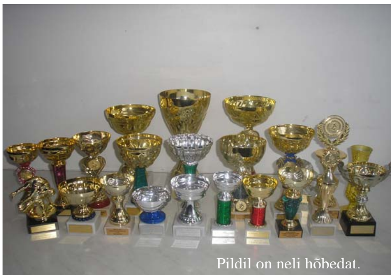
Pildil on neli hõbedat.

Ma olen 3-kordne Eesti meister vabamaadluses ja olen ka 2-kordne Eesti meister kreeka-rooma maadluses. Olen olnud ka kaks korda teine Eesti meistrivõistlustel kreeka-rooma maadluses.